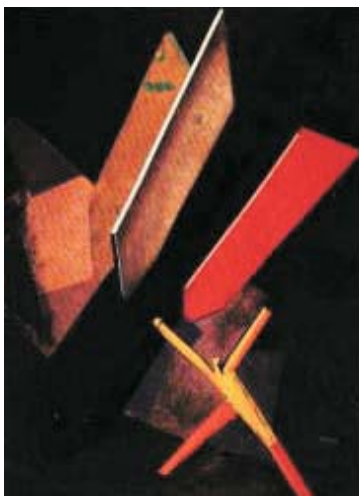
"La bomba" di Mario Sironi (1918-19)