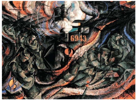
"Stati d'animo: Gli Addii" di Umberto Boccioni (1911)