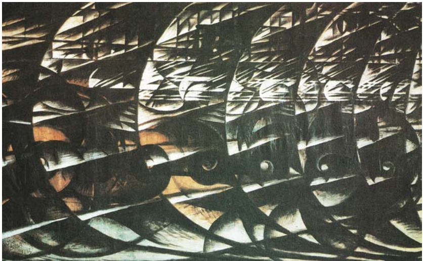
“Velocità astratta” di Giacomo Balla (1913-14)

I temi fondamentali del lavoro di ricerca stilistico sono stati il rumore, la velocità e l' "assenza di punteggiatura". La danza che ne scaturisce è una danza lineare, rumorosa ed essenziale.