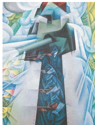
"Treno blindato" di Gino Severini (1915)