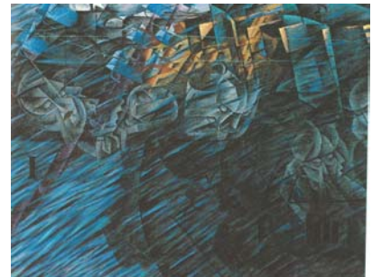
"Stati d'animo: Quelli che vanno" di Umberto Boccioni (1911)

"Il Futurismo non fu una semplice celebrazione della macchina e della sua estetica. Di fatto l'esaltazione futurista del modernismo non avrebbe mai dimenticato l'umanesimo che alimenta le radici stesse della cultura italiana"