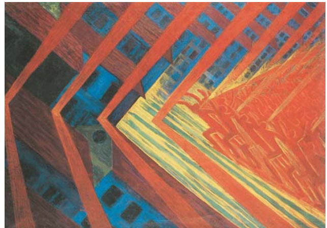
"La rivolta" di Ugo Russolo (1911)

"Uno dei compiti principali dell'arte è stato da sempre quello di generare esigenze che non è in grado di soddisfare attualmente"